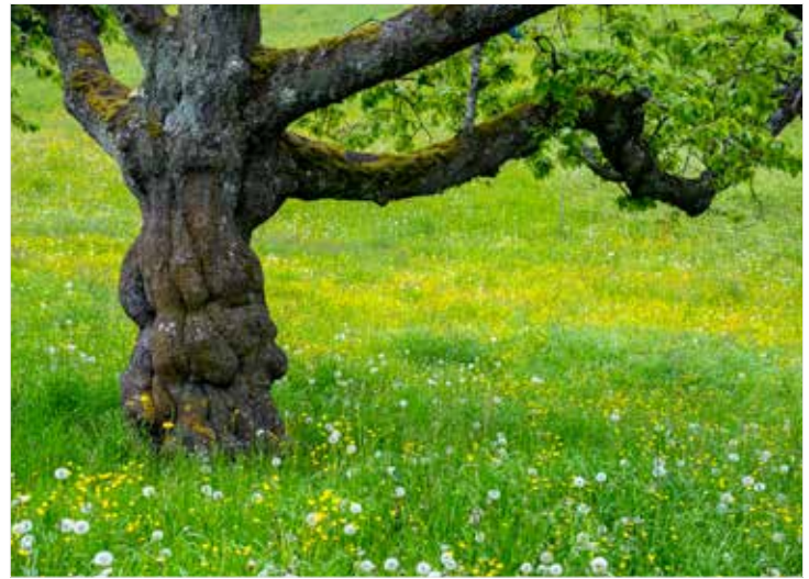
Psalms 1 vergleicht Menschen, die auf das Wort Gottes hören, mit Bäumen, die tief im Erdreich wurzeln.

Das Judentum ist zutiefst geprägt von dieser Erfahrung: Wüstenwanderung, Exil, Zerstörung des Tempels, Zerstreuung in alle Welt und wiederkehrende Verfolgungserfahrungen hatten zur Folge, dass es seine Verwurzelung im Glauben neu definierte: Nicht mehr über das Land und nicht mehr über den Tempel, sondern über die nicht an einen Ort gebundene Bibel. Der jüdische Dichter Heinrich Heine bezeichnete sie als «portatives Vaterland», welches das immer wieder vertriebene