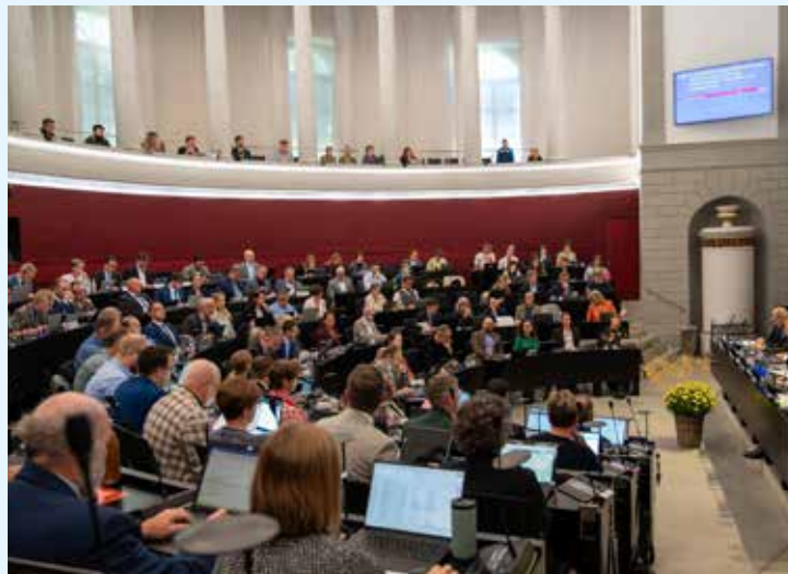
Kantonsratsmitglieder an einer Sitzung. Die Kirche steht mit manchen von ihnen in engem Austausch.

Freitag stellt fest, dass der Dialog Früchte trägt. Als Beispiel führt er das Postulat an, mit dem eine FDP-Kantonsrätin die kirchliche Besteuerung der juristischen Personen hinterfragte und das vor einem Jahr deutlich abgelehnt wurde. Daraus lasse sich ableiten, dass eine Mehrheit des Kantonsrats diese Steuer als «wichtigen Beitrag der Wirtschaft an die Zivilgesellschaft und den gesellschaftlichen Zusammenhalt» verstehe. do