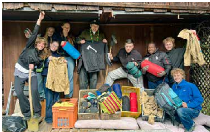
Noch brauchbar und nützlich: Die Pfadi Seppel Luzern hat als eine von vielen Abteilungen für «Lager für alli» gesammelt.