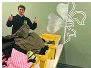
Vom Schlafsack bis zu Wanderschuhen: Die «Lager für alli»-Sammlung der Pfadi Eschenbach.