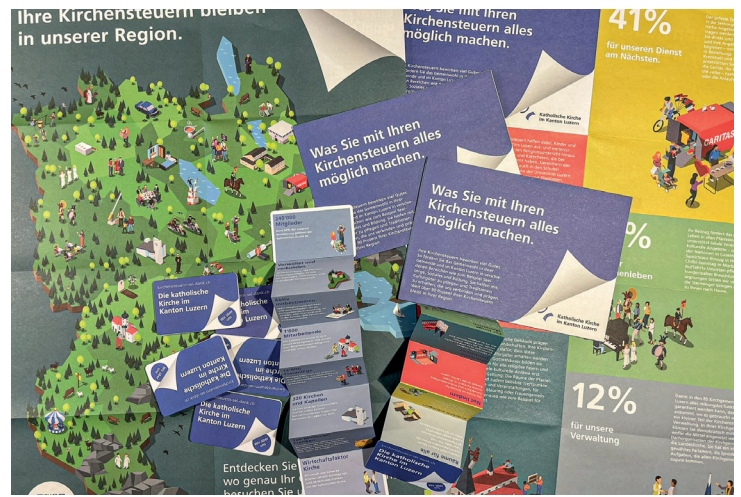
Der Faltprospekt und Leporello von «Kirchensteuern sei Dank» sind demnächst wieder erhältlich.