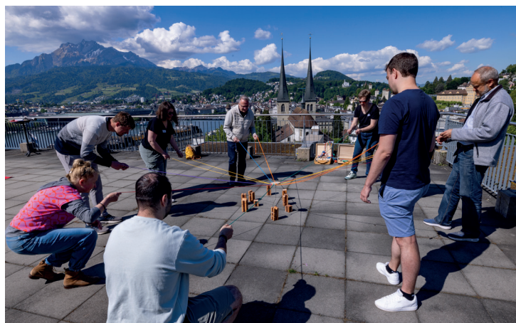
Spielerisch das Eis brechen: am Einführungstag für den Spielverleih im Mai des vergangenen Jahres.