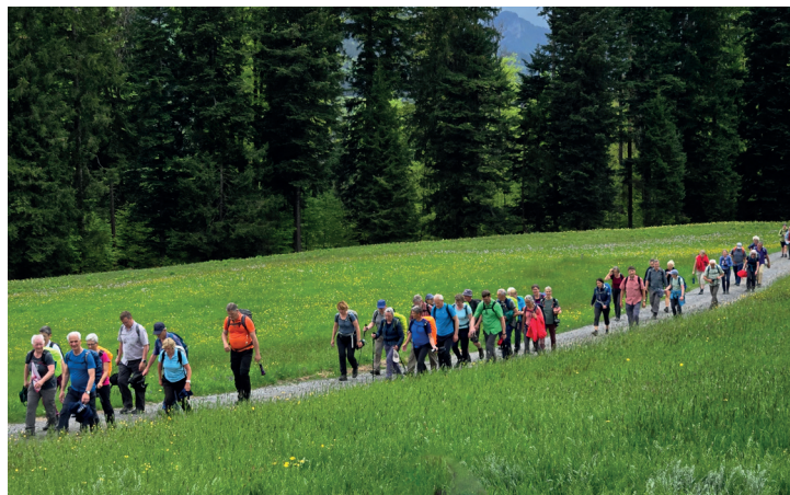
Unterwegs zu Fuss nach Einsiedeln am 3. Mai 2025. Dieses Jahr findet die Fuss- und Velowallfahrt am 2. Mai statt.