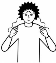
Au d Bärge