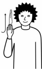
alles hesch du Gott gmacht.