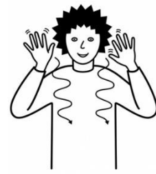
de chalti Schnee,