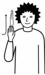
alles hesch du Gott gmacht