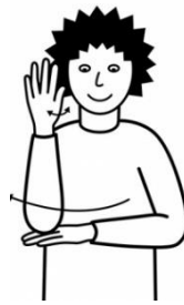
d Wälder und