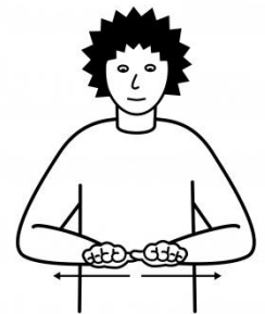
uf em Tisch.