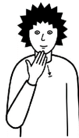
danke, das du