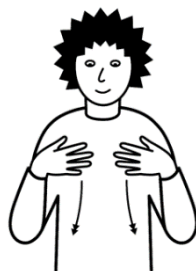
Chleider ha und