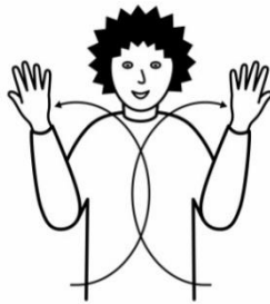
dunkle Tage du mis