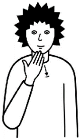
Danke, das au i