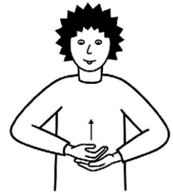
min Hälfer bisch