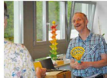
Zufriedene und fröhliche Gesichter: Bilder aus dem Delsberger Ferien- und Besinnungskurs für Menschen mit einer geistigen Behinderung.