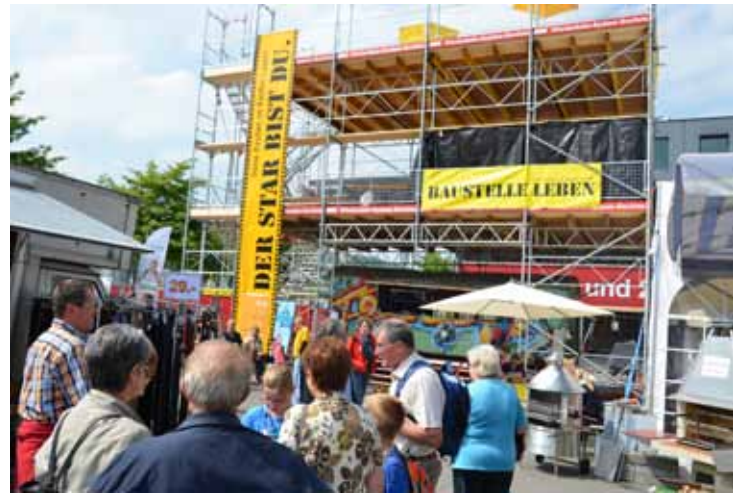
War nicht zu übersehen: Die «Baustelle Leben» an der LUGA 2011.