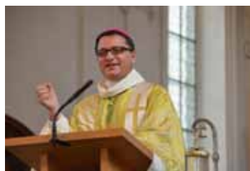
Bischof Felix Gmür bei der Errichtung des Pastoralraums Horw am 20. November 2011.