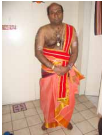
Der Hindupriester und Autor Saseetharen Ramakrishna Sarma.

Wer an den Grundzügen der hinduistischen Religion interessiert ist, findet im Schlussteil eine kurze Zusammenfassung der wichtigsten