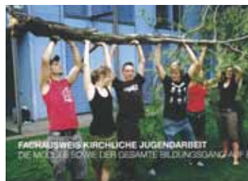
Kirchliche Jugendarbeit oder: Miteinander ist manches möglich. Titelbild der Broschüre zum neuen Bildungsgang.